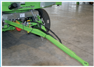
Dyszel typu Y - łatwe manewrowanie

SZCZELNA UNIWERSALNA PRZYCZEPA DOSTĘPNA W MAGAZYNIE