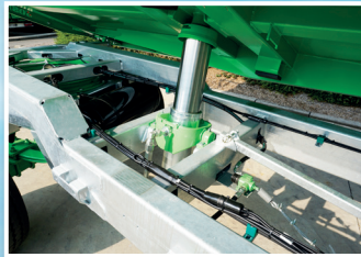
Rama ocynkowana i obniżona