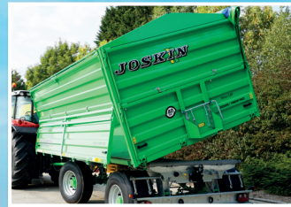
Burty 2 x 80 cm całkowicie demontowane